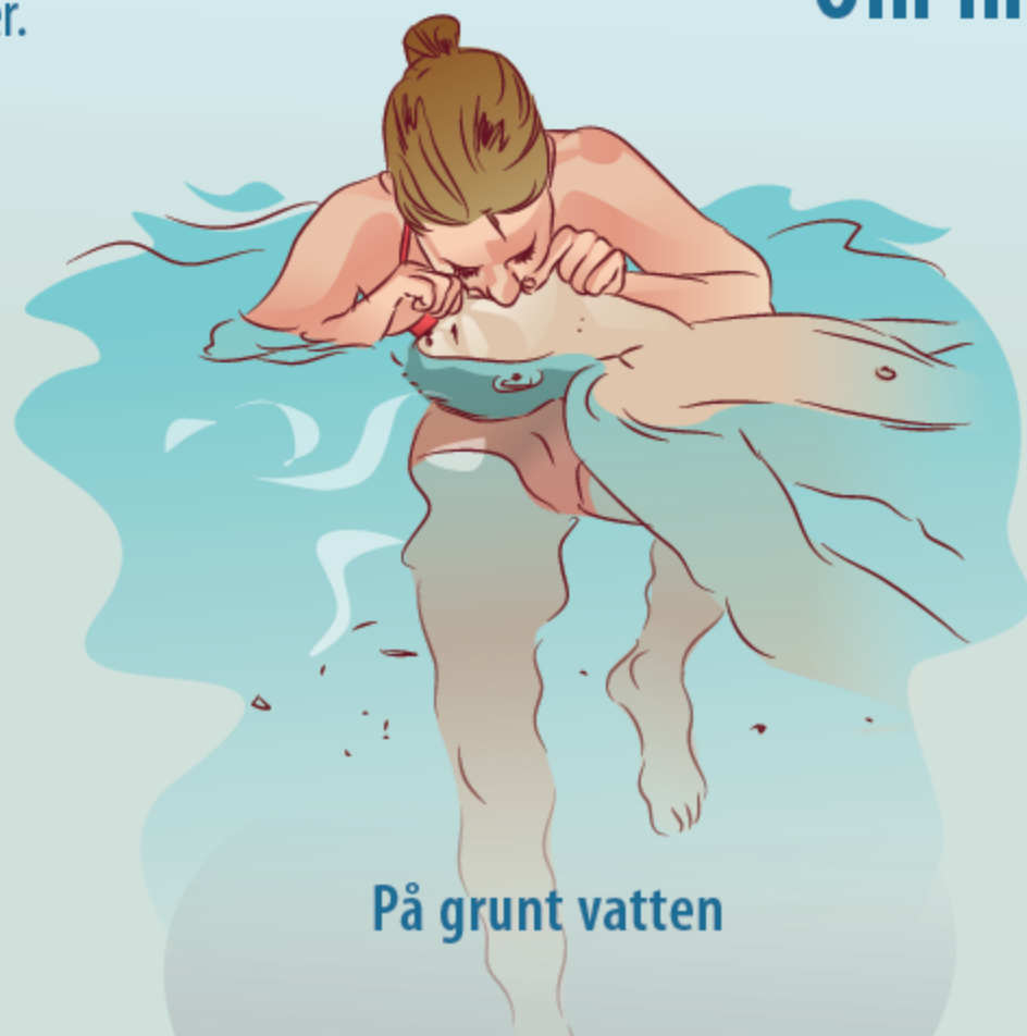
På grunt vatten

Behåll kontakten med larmoperatören tills ambulanspersonal tar över.